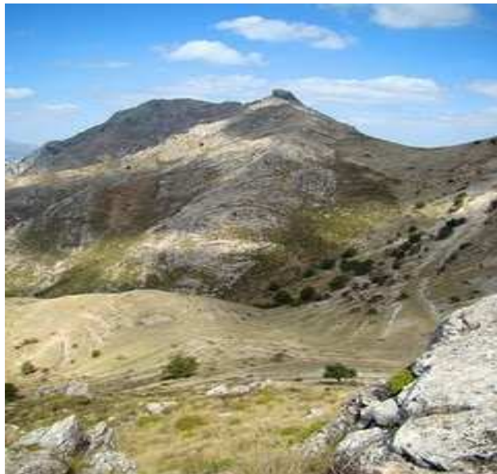
Vistas del Puerto del Cerezo