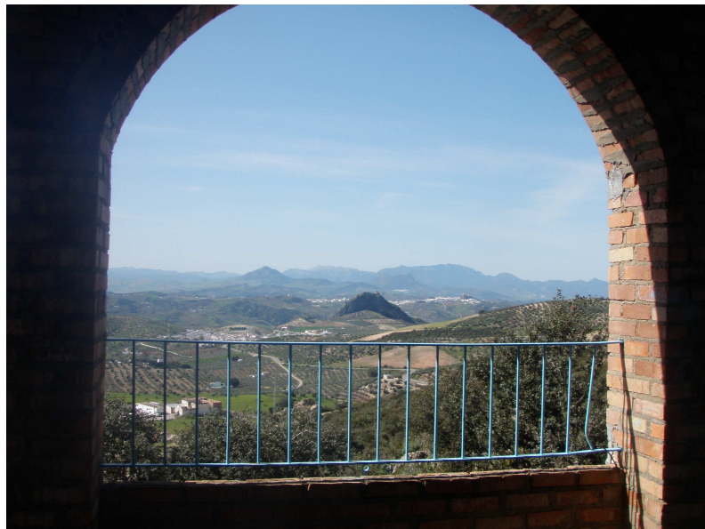
Vistas desde la Ermita