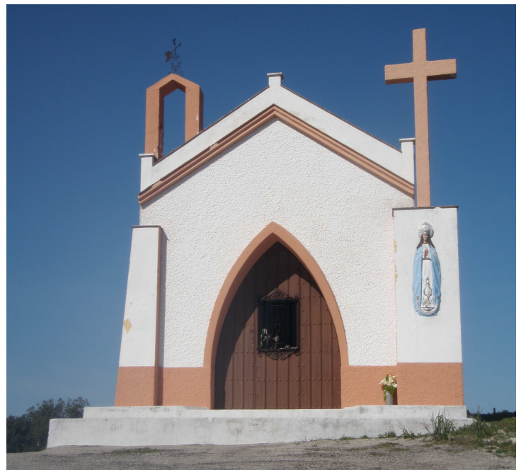
Ermita Virgen de Fátima

Qué incluye la actividad: Transporte, Seguro de Responsabilidad Civil y de Accidentes. Monitores cualificados, expertos en senderismo e interpretación de la naturaleza. Vehículos de apoyo si fuera necesario. Mapas y brújulas.